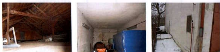
Garáže č.p. 340 Jílové, Javorská