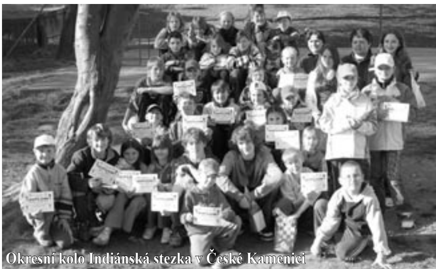
Okresní kolo Indiánská stezka v České Kamenici