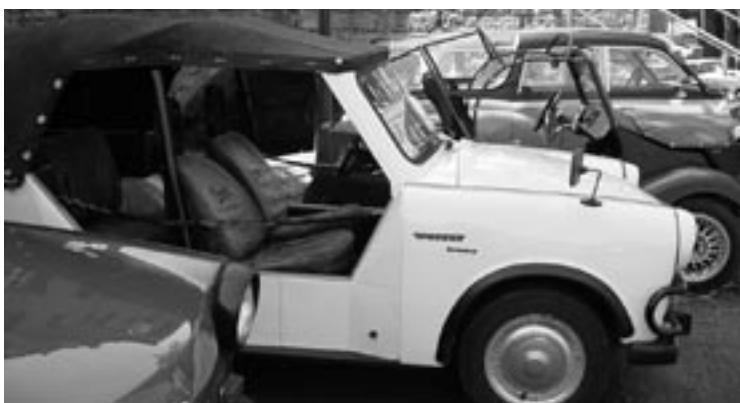
Fotografii z nádvoří Jílovského zámku se vracíme k vikendové akci „Trabantí srážení“. Návštěvníci měli možnost vidět řadu hezky ošetřovaných, udržovaných a upravených trabantů.